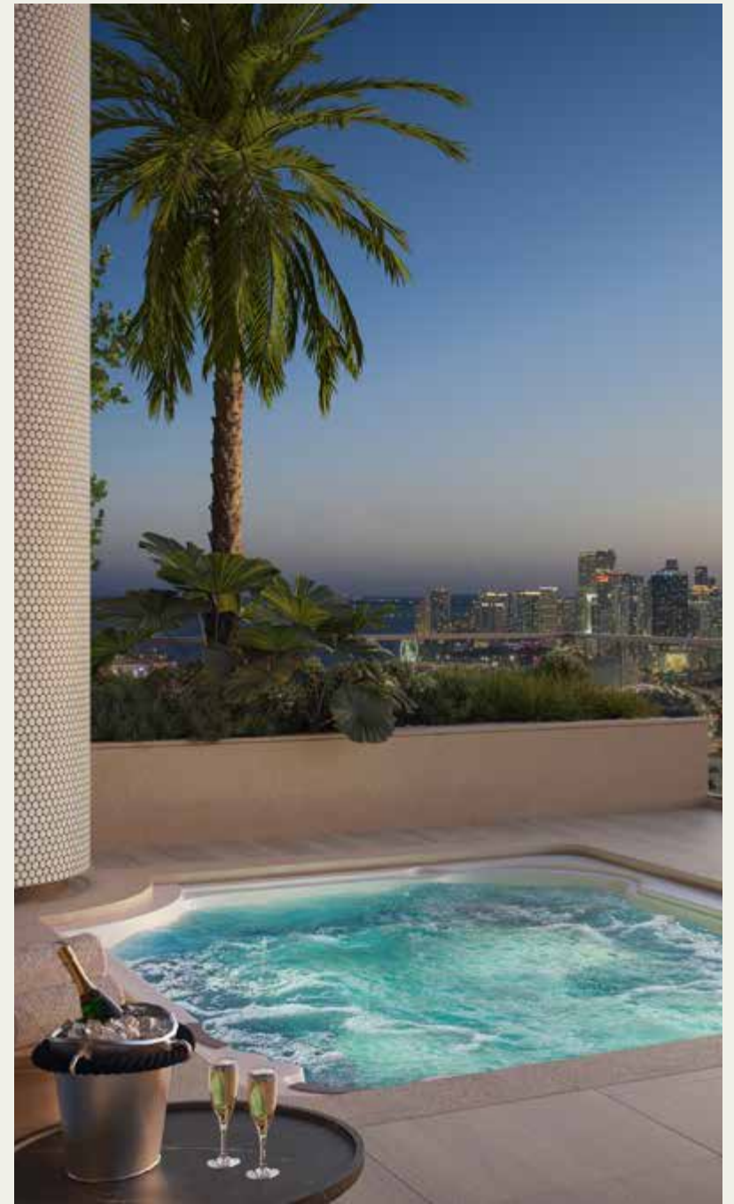
BAR DE PISCINA Y JACUZZI