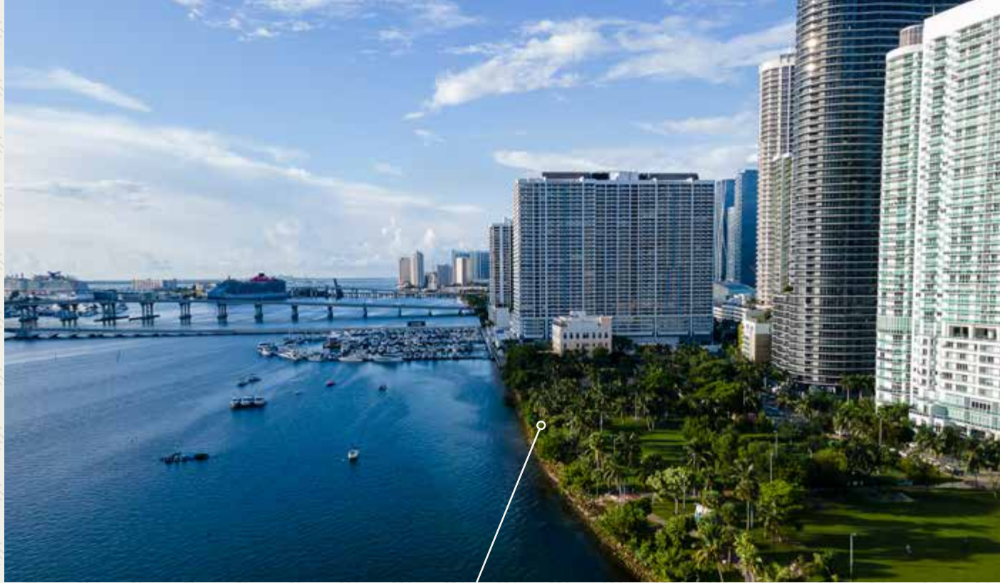
SENDERO JUNTO AL AGUA

Los residentes también disfrutarán de una conectividad sin esfuerzo gracias al Brightline, el tren de alta velocidad, al Metromover gratuito, que conecta fácilmente con Downtown y Brickell, y al Miami Trolley, que enlaza Edgewater con los distritos más importantes de la ciudad.