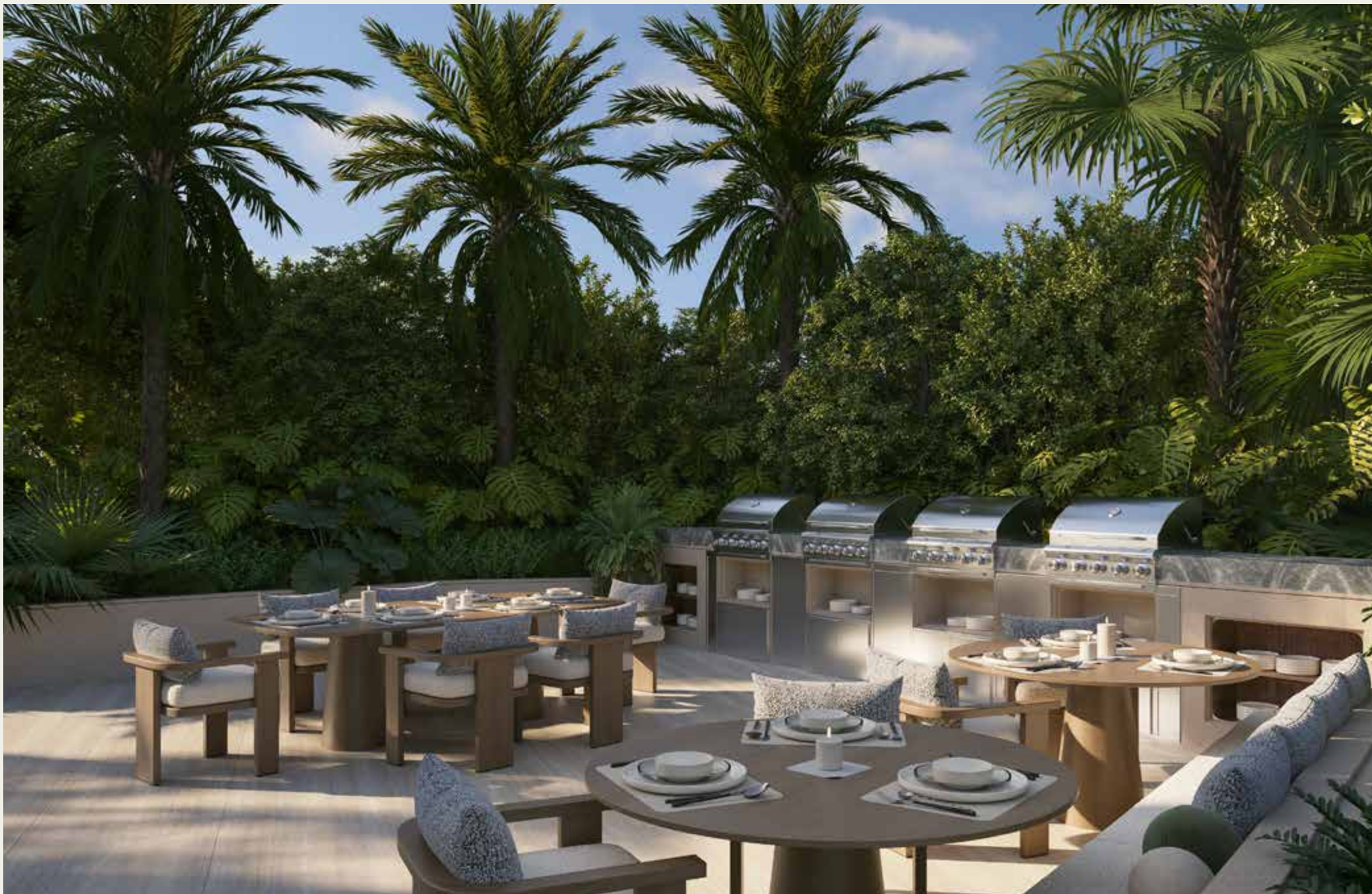
COCINA DE VERANO