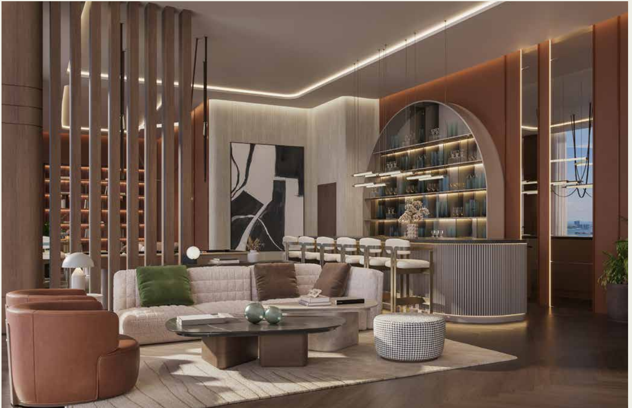
SKY BAR Y LOUNGE